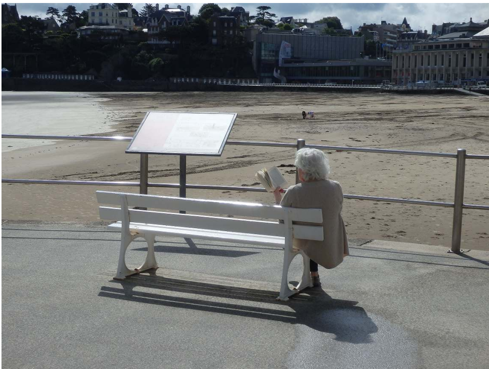
Photo 2 : Dinard, un mobilier qui donne l'occasion de se (re)poser